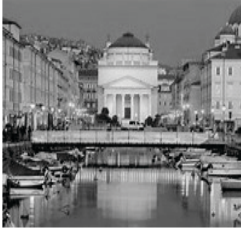
Trieste – Borgo Teresiano con il Canale Ponterosso

Tempo fa ho letto con la massima attenzione il lucido ritratto della nostra città sul libro “Trieste” dello scrittore Günther Schatdorfer.