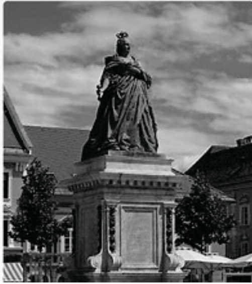
Klagenfurt Austria Maria Teresa

Trieste conserva ancora un barlume di rispetto per l'ambiente in cui vive, verso i cristiani e gli infedeli che ci abitano. La città ha cinque cimiteri di culti diversi, inoltre conserva una riservatezza acquisita dagli austriaci e dagli italiani del nord che differisce moltissimo dall'esuberanza tipica dell'Italia meridionale che ama scherzare sulla nostra presunta freddezza . Già prima, quando si trattò di far conoscere alla mia famiglia il nuovo membro e mio futuro marito, fui sottoposta ad un fuoco di fila di domande che scaturirono scrutando la fotografia del nostro primo ballo.